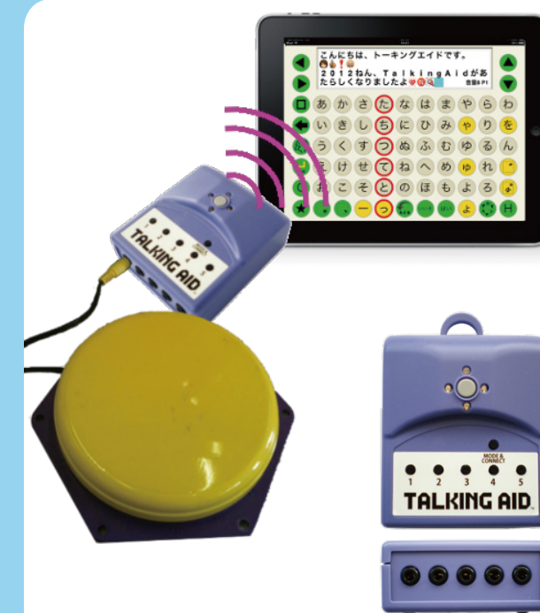
1~5個のスイッチ接続可

プロテクターケース専用のキーガードです。指に震えがある場合などに有効です。専用キーガードは単体では利用できません。プロテクターケースが必要です。