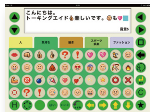
絵文字キーボード