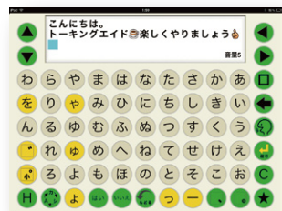
かな文字キーボード

ひらがな、カタカナ、アルファベットなどの文字を入力して文章を作り、4種類の合成音声で読み上げたり、印刷したり、メールをやり取りしたりできます。さらには、ソフトバンク携帯でお馴染みの絵文字を交えることもできます。これまでにない表現力豊かなコミュニケーションエイドでしょ？