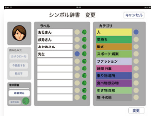
シンボル辞書編集画面