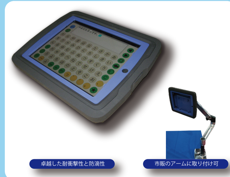
卓越した耐衝撃性と防滴性