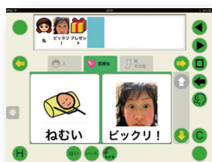
任意画像の2分割キーボード